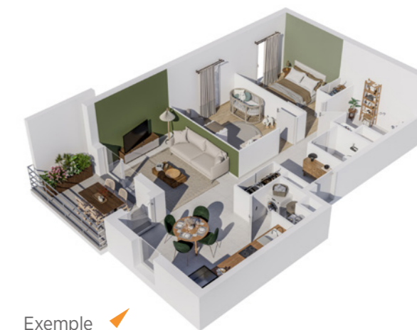
Exemple d'appartement 3 pièces avec balcon